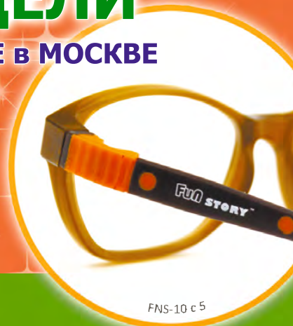
FNS-10 с 5