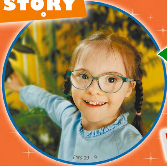
FNS-09 с 9